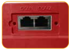
• Terminal Kommunikation Schnittstelle