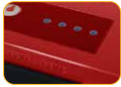
• 4 Betriebsanzeige