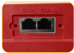
• Terminal Kommunikation Schnittstelle