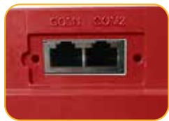
• Terminal Kommunikation Schnittstelle