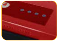
• 4 Betriebsanzeigen